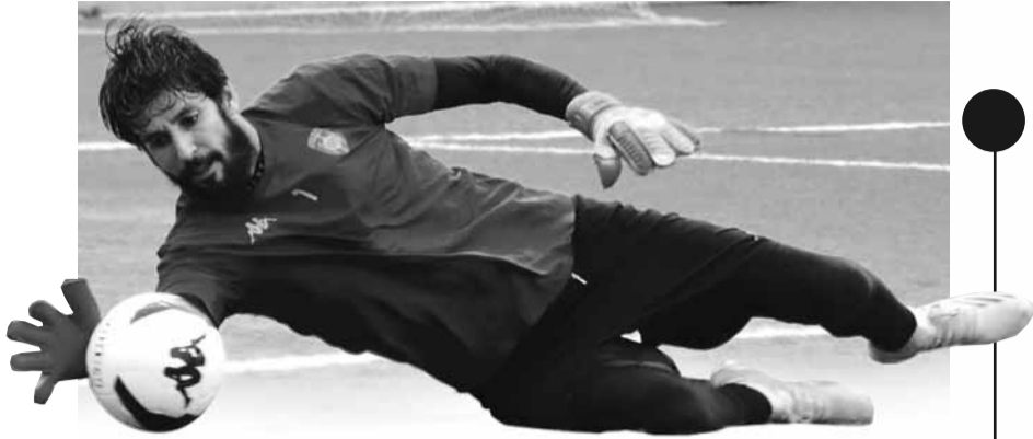
فيما أبدت إدارة "سوسطارة" تمسكها بلوصيف