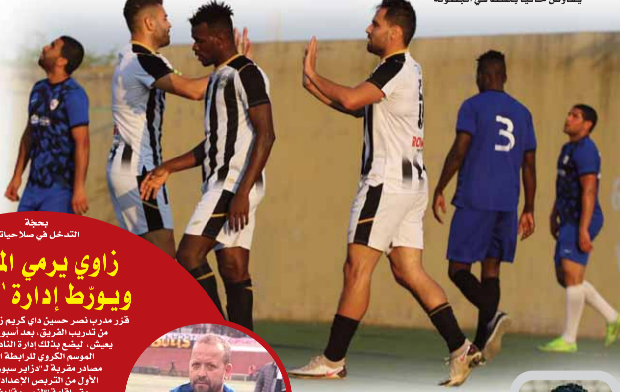
بحة التدخل في صلاحياته