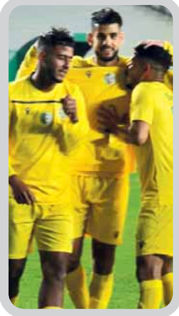
الجولة الثالثة من دور المجموعات لكأس الكونفدرالية الإفريقية