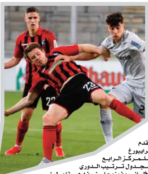
تقدم فرايبورغ للمركز الرابع بجدول ترتيب الدوري