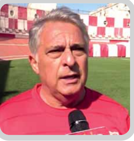
فيما أبدى مخاوفه من تأثر لاعبيه الدوليين بالإرهاق

التي قد تفيده في ذلك، واستفادة المولودية من التوقف الاضطراري للبطولة قد تكون مفيدة لاستعادة التوازن بعد أربع جولات كارثية حقق فيها 3 تعادلات وهزيمة في الداربي أمام المتصدر. وأي تعثر للشاورة في تنقلهم الصعب للضباب العليل قد يخدم المحطرين المباشرين في الصف الـ 4 شباب قسنطينة وأتليتيك بارادو الباحثان عن خطف المركز الـ 3، حيث سيكون السنايفر في تنقل سهل نسبيا لاقليم التيطيري في مواجهة أولمبي المدية المتواجد في خانة المهديين بالسقوط وسيلعب على الفوز لإنقاذ نفسه، فيما يبقى نادي الأكاديمية أمام فرصة ذهبية لحصد النقاط الثلاث على أرضية ملعبه حين يستقبل الجريج سريع غليزان المتهاوي جولة بعد جولة. وفي حسابات البقاء أيضا يستقبل أمل الأربعاء الضيف نجم مقرة في مباراة يصعب التكهن بنتيجتها بين صاحبي المرتبة الـ 11 والـ 12 مع أفضلية لـ "الزرقا" على ملعبها، فيما يبقى نصر حسين داي الـ 16 أمام فرصة لخطف ثلاث نقاط ثمينة حين يستقبل صاحب المرتبة الأخيرة ووداد تلمسان.