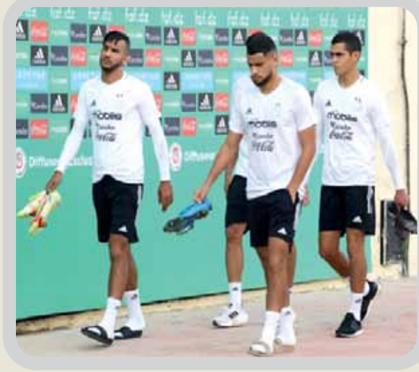
الخضري يجرون أول حصة تدريبية استعدادا لموقعة أوغندا