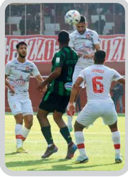
الجولة الـ 12 للرابطة المحترفة الأولى