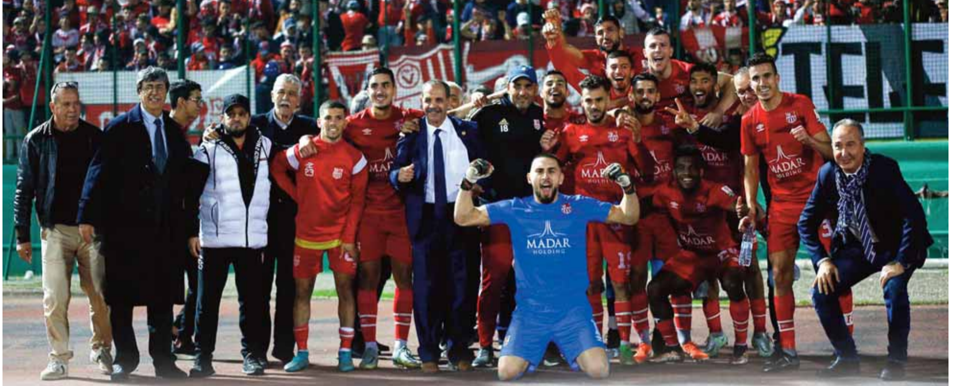
الجولة 15 للرابطة المحترفة الأولى