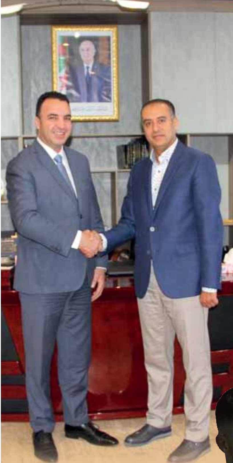
اللقاء كان مثمرا وبناء بهدف خدمة الكرة الجزائرية