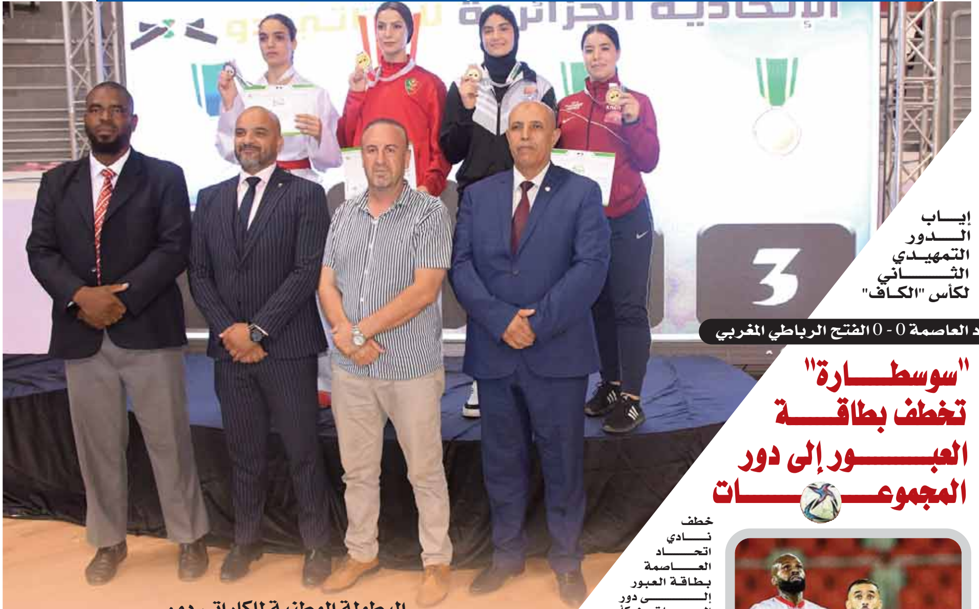
إياب الدور التمهيدي الثاني لكأس "الكاف"

إتحاد العاصمة 0 - 0 الفتح الرباطي المغربي