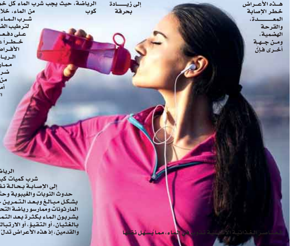
العناصر الغذائية الأساسية التي في الماء، مما يُسهل نقلها