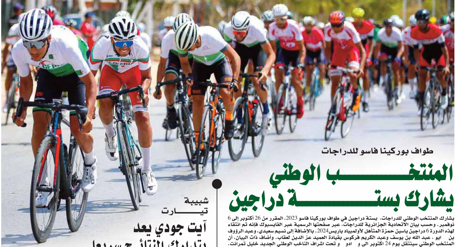
طواف بوركينافاسو للدراجات