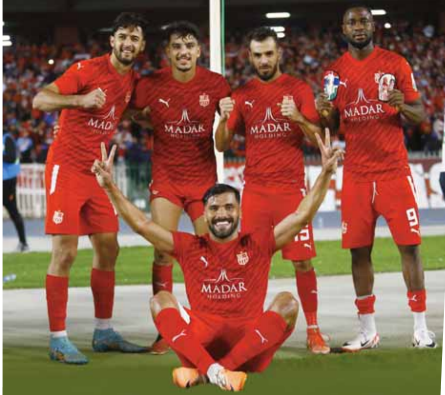
الجولة الافتتاحية من دور المجموعات لرابطة أبطال إفريقيا شباب بلوزداد - يونغ أفريكانز التنزاني (غدا بداية من سا 20:00)