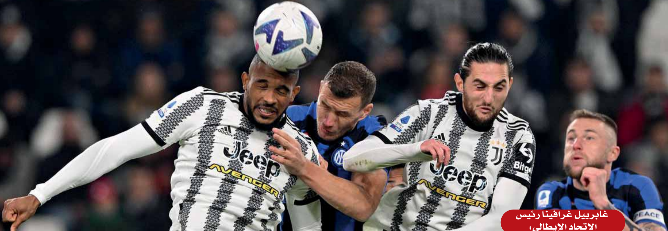
غابرييل غرافينا رئيس الاتحاد الإيطالي؛