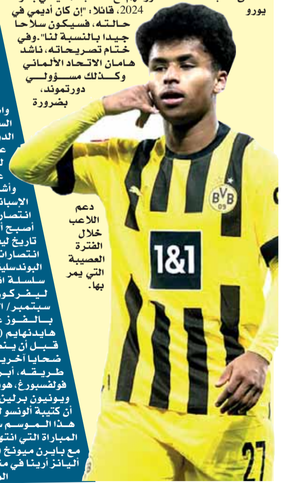
دعم اللاعب خلال الفترة العصيبة التي يمر بها.

قرب بوروسيا دورتموند تأخره بهدفين أمام غلادباخ إلى فوز مثير برعاية ليحصد ثلاث نقاط غالية في الجولة 12 من البوندرسليغا. الشوهر رف رصيد دورتموند إلى 24 نقطة في المركز الرابع وتوقف رصيد غلادباخ عند 13 نقطة في المركز 11. وتقدم مونشنغلادباخ بهدفين حملا توقيع روكو ريتز وكواديو كونييه في الدقيقتين 13 و 28 ثم رد مارسيل سابيتزر وفيكلاس فولكروغ بهدفين لدورتموند في الدقيقتين 30 و 32. وجاء الهدف الثالث لدورتموند بواسطة جيمي بينو جيتنز في الدقيقة 45 وتكفل دونيل مالين بتسجيل الهدف الرابع في الدقيقة الأخيرة.